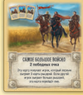
Самое большое войско