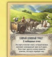
Самый длинный тракт