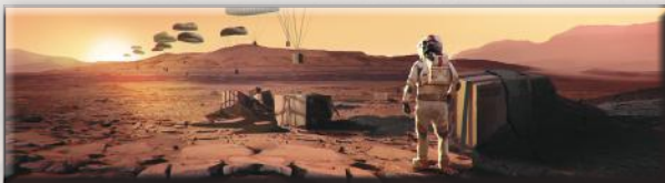
«Поставка снабжения» (Гарретт Каида)

Этот вариант игры можно использовать с любыми дополнениями. Теперь, вместо того, чтобы увеличивать глобальные параметры, ваша цель — повысить свой РТ до 63 за 14 поколений (или за 12, если вы играете с картами прологов). Пометьте 63-е деление золотым кубиком. В этом варианте игры добавляется новый стандартный проект «Буферный газ», который стоит 16 М€ и повышает ваш РТ на 1. В остальном действуют обычные правила игры в одиночку.